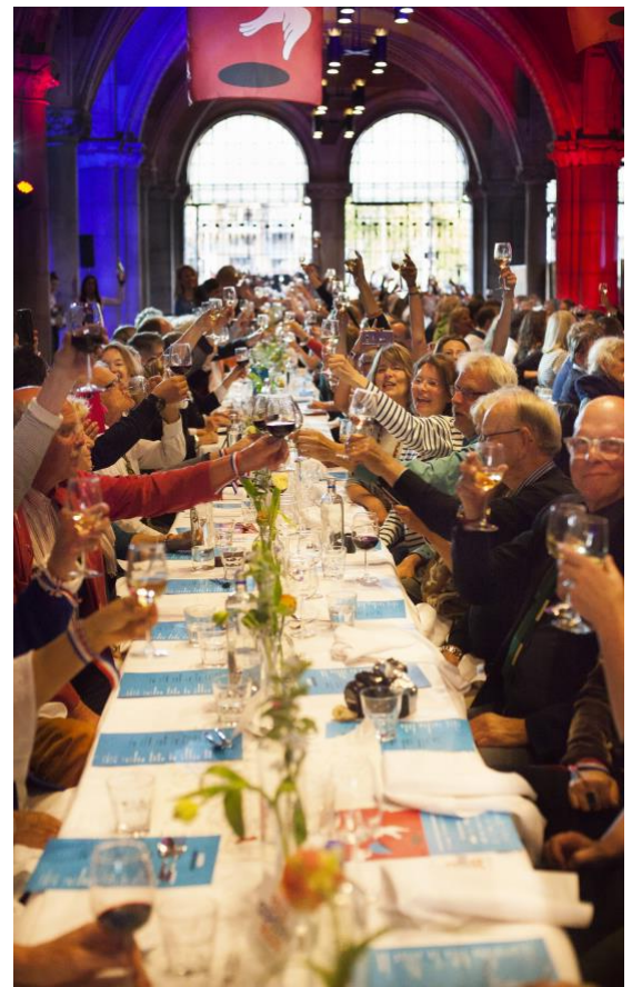
Afbeelding 1 - Vrijheidsmaaltijd onder de bogen van het Rijksmuseum, 2018.

De afgelopen jaren zijn de Vrijheidsmaaltijden enorm in populariteit toegenomen: in 2018 werden in Amsterdam meer dan 100 Vrijheidsmaaltijden georganiseerd. Het vertrekpunt van elk van deze maaltijden is de oorlogsgeschiedenis in Amsterdam. Aan de ene kant komt dit tot uiting in de door het Amsterdams 4 en 5 mei comité beschikbaar gestelde tafelkleden met de voorpagina van Het Parool van 6 mei 1945 en aan de andere kant in het feit dat er in de opening van de maaltijd altijd wordt benoemd dat het 5 mei is. Het ideaal van verbinding als grootste erfenis van de Tweede Wereldoorlog is een van de belangrijkste inhoudelijke thema's van de Vrijheidsmaaltijden, maar er wordt in Amsterdam ook veel aandacht gegeven aan actuele thema's en lokale geschiedenisverhalen. In Amsterdam wordt ongeveer een kwart van de Vrijheidsmaaltijden georganiseerd door programmamakers van grotere instellingen, zoals musea, theaters en universiteiten. Ook doen jaarlijks een aantal bedrijven mee, zoals hotels en restaurants. Het grootste aandeel van de Vrijheidsmaaltijden in Amsterdam wordt echter georganiseerd door vrijwilligers van buurthuizen, sportclubs, kerken en sociale organisaties.