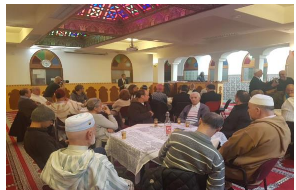
Afbeelding 3 - Vrijheidslunch Al Kabir Moskee Amsterdam, Vrijheidstour Oost.

De locatie is in het geval van de Vrijheidsmaaltijd een zeer flexibel, zo niet het meest flexibele, element. Het kan op straat, in een park, in een buurthuis, een woonzorgcentrum, een museum, een moskee, een theater, of bijvoorbeeld onder de bogen van het Rijksmuseum georganiseerd worden. Als de locatie ook een historische link heeft, bijvoorbeeld met lokale gebeurtenissen tijdens de Tweede Wereldoorlog, kan de locatie van invloed zijn op de inhoud van het gesprek en een rol spelen in het creëren van een bijzondere ervaring tijdens de Vrijheidsmaaltijd. In een cultureel diverse wijk kan het goed zijn om als locatie voor een neutrale, aansprekende locatie te gaan, zoals een buurthuis of een plein. Als het juist de doelstelling is om verschillende culturen en achtergronden met elkaar