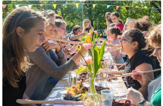
Afbeelding 4 - Lieve mensen Vrijheidsmaaltijd, WOW Amsterdam 2018

De organisator van Vrijheidsmaaltijden vanuit WOW Amsterdam in Amsterdam West heeft geen gebruik gemaakt van de tafelkleden met krantenkoppen van de bevrijding, omdat ze dit vrij heftig vond en niet vond aansluiten bij de doelgroep. In de buurt waar deze organisator de Vrijheidsmaaltijd organiseerde, wonen veel mensen met een migratieachtergrond, zodat er veel verschillende culturen bij elkaar aan tafel zaten, waardoor de concrete verbinding met de Tweede Wereldoorlog niet zo aansprak. Wel waren er voor deze Vrijheidsmaaltijd door een kunstenaar lange lepels gemaakt, waarmee mensen die tegenover elkaar zaten elkaar konden 'voeren' (zie afbeelding 4). Dit